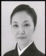
鳴物 鼓友 緑佳