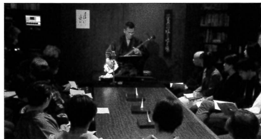
春慶に撥をしつらえ、名曲「雪の山中」に聴き入る。