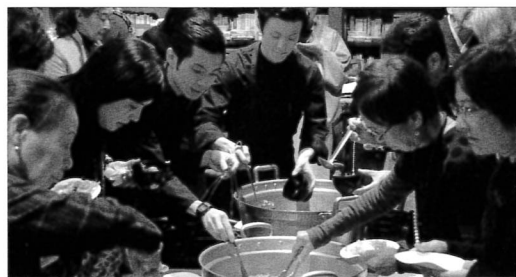
真中シェフの大鍋料理に我も我もと手が伸びる。