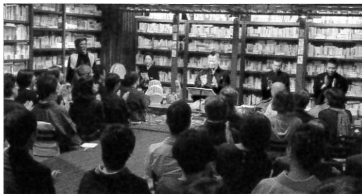
本棚劇場に響く、アイヌくにぶりうた「ウンドコ」の手拍子。