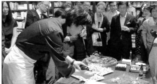
ダ・フィオーレ真中シェフのお料理。ピネガーマジックに目を見張る。