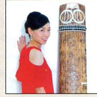
寺井結子 箏