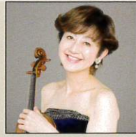
大谷康子 ヴァイオリン