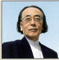
一柳慧 ©岡部好 作曲