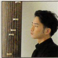
中島裕康 ©ヒダキトモコ 箏