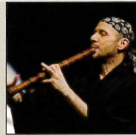
ジョン海山ネブチューン 尺八